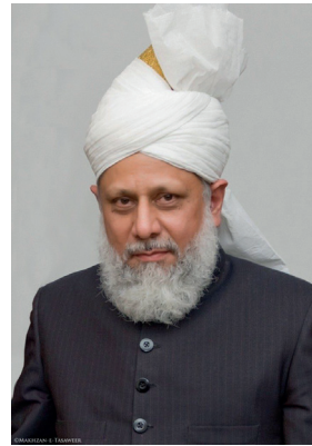
Hazrat Mirza Masroor Ahmad leader mondiale della comunità musulmana Ahmadiyya

„Siate gentili e misericordiosi con l'umanità, perché tutti sono creature di Dio: non opprimerle con la lingua, le mani o in qualsiasi altro modo. Lavorate sempre per il bene dell'umanità“.