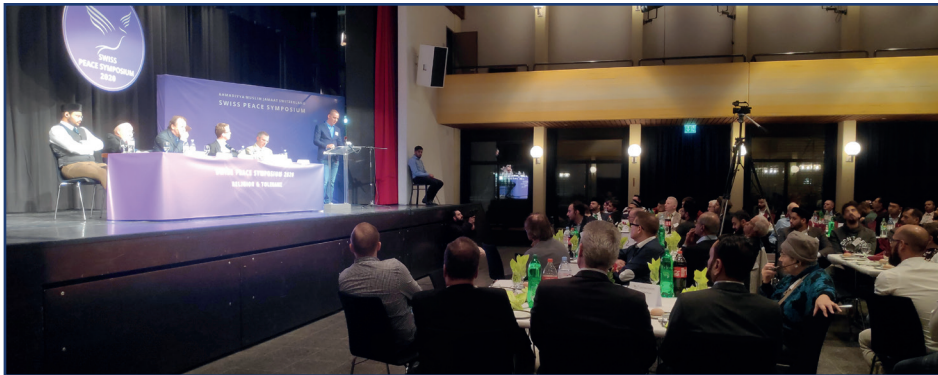
Swiss Peace Symposium 2020

Questo simposio è un evento importante della Comunità Ahmadiyya Svizzera. Si ispira al „Simposio sulla pace“ del Jamaat musulmano Ahmadiyya nel Regno Unito, che è una delle tante iniziative di Sua Santità Hazrat Mirza Masroor Ahmad. Promuove una più profonda comprensione dell'Islam e di altre fedi e cerca di ispirare uno sforzo concertato per una pace duratura. Il motto della simmetria della pace di quest'anno è „Insieme per un mondo migliore“.