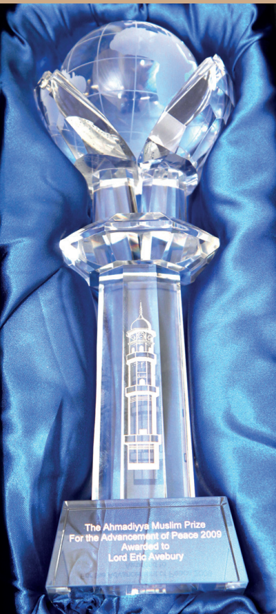
Foto: Il „Ahmadiyya Peace Prize“ per il progresso della pace assegnato dal 2009 al Simposio sulla pace dell'Ahmadiyya Muslim Jamaat UK.