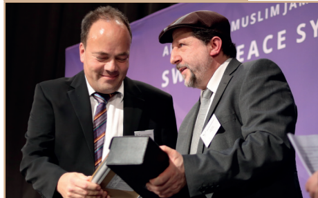
DAN Basel, Gewinner Peace Award

Die Auszeichnung wird anlässlich des Swiss Peace Symposiums am 25. April 2024 zum zweiten Mal vergeben. Es umfasst eine Trophäe sowie eine Urkunde und einen Geldpreis in der Höhe von 3000 Schweizer Franken.