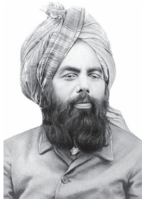
Hazrat Mirza Ghulam Ahmad Der Verheissene Messias & Mahdi (Friede sei auf ihm)

Die Ahmadiyya Muslim Jamaat wurde 1889 durch Seine Heiligkeit Hazrat Mirza Ghulam Ahmad (1835 – 1908) aus Qadian im heutigen Indien gegründet. Er beanspruchte der erwartete Reformers der Letzten Tage und von allen Weltreligionen erwartete Messias und Mahdi zu sein. Seine Mission war die Wiederbelebung der friedlichen Lehren des Islam und Erweckung der Liebe in den Herzen der Menschen für Gott und für den Dienst an der Menschheit.