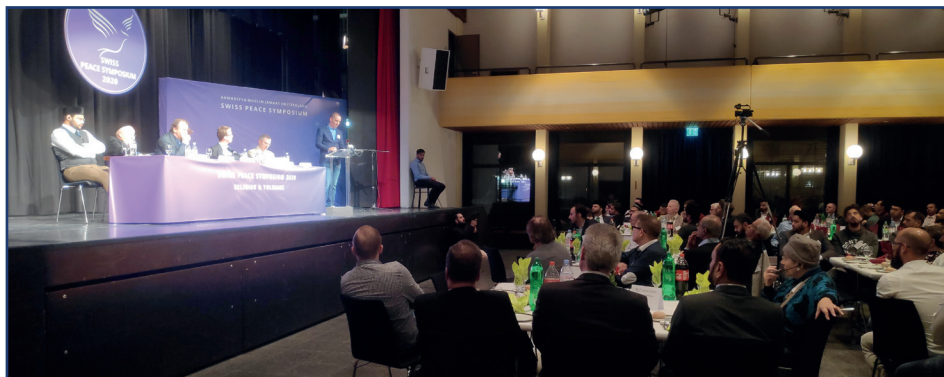
Swiss Peace Symposium 2020

Das „Swiss Peace Symposium“ ist eine wichtige Veranstaltung der Ahmadiyya Muslim Jamaat Schweiz. Es folgt dem Vorbild des „Peace Symposium“ der Ahmadiyya Muslim Jamaat im Vereinigten Königreich. Es fördert ein tieferes Verständnis des Islam und anderer Glaubensrichtungen und soll zu einer gemeinsamen Anstrengung für einen dauerhaften Frieden anregen. Das diesjährige Friedenssymposium steht unter dem Motto „Gemeinsam für eine bessere Welt“.